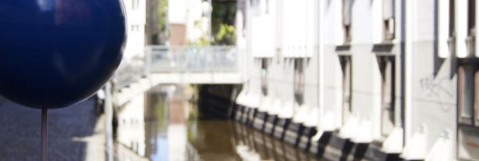
Auf der Umlaufbahn in der Fischerau; Foto: Elisa Peyker