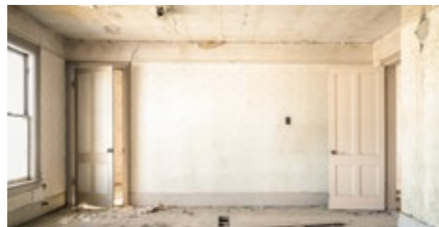
Sanierung der Villa Mitscherlich in Freiburg i. Br..

Barrierefreie Parkplätze (Wiese): Fischermatte 3a, 79111 Freiburg.